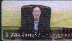
สสง. จันทบุรี / ... Unverified