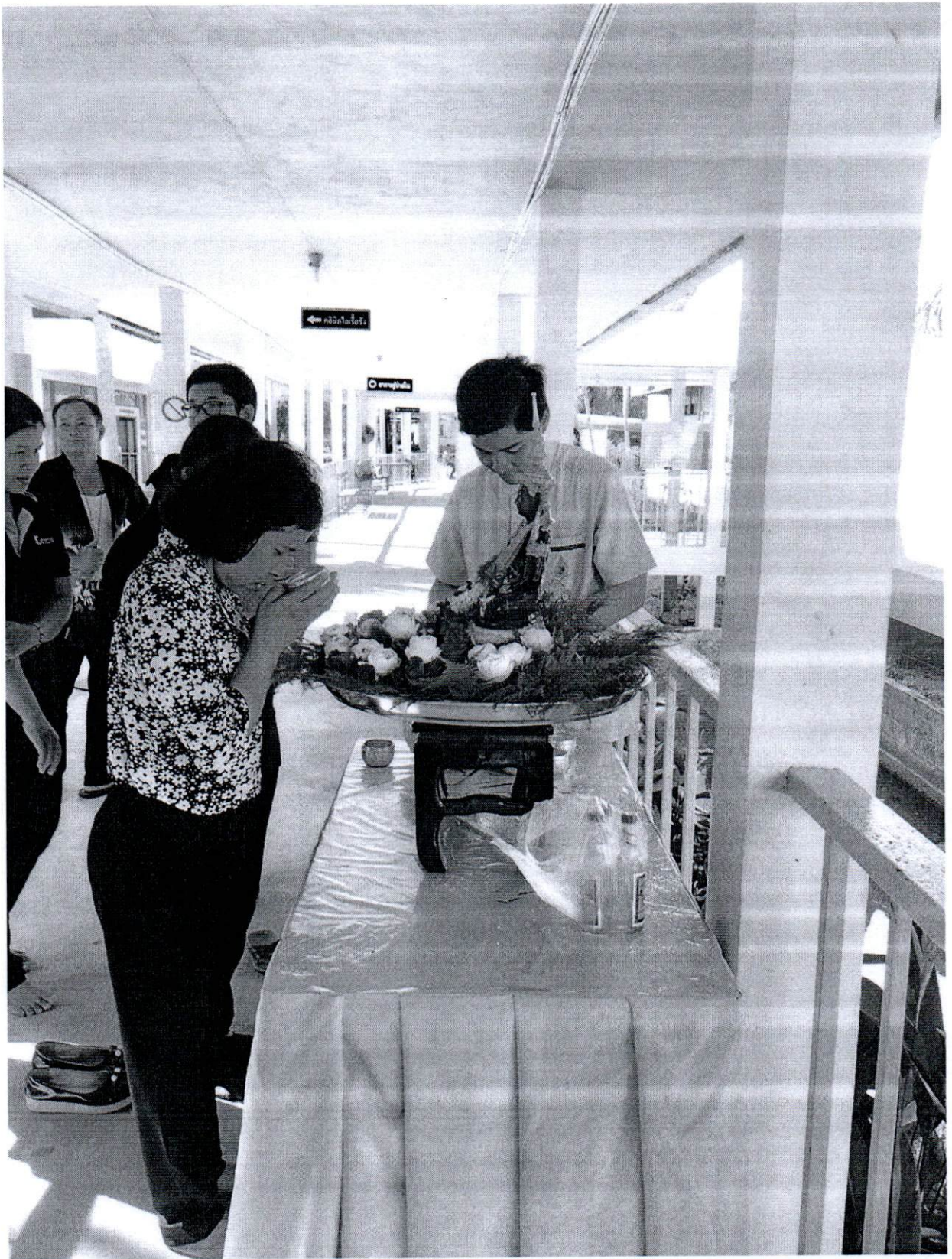
กิจกรรมวัฒนธรรม วันสงกรานต์